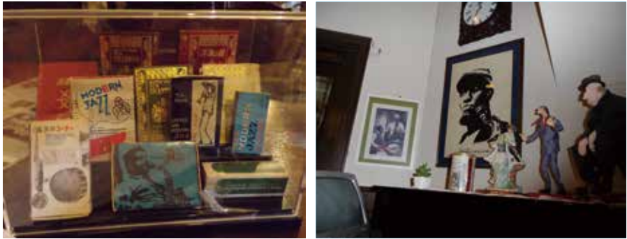
コーヒーをたてながらマッチ箱のイラスト、改装前の店外の看板等をマスターが描いていた。仕事と趣味を両立されていたのが作品をみるだけで伝わってくる